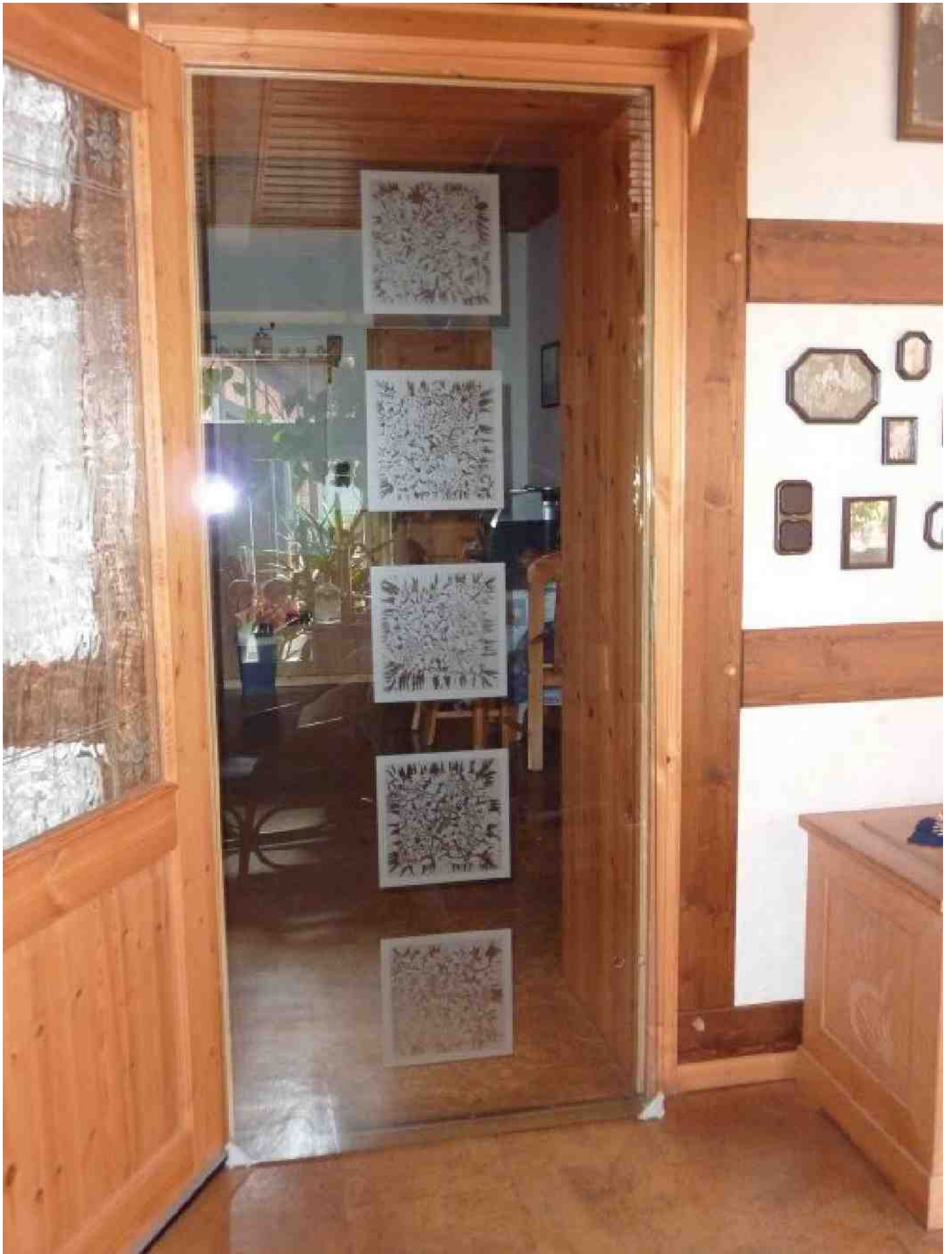
Glastür - Eisblume