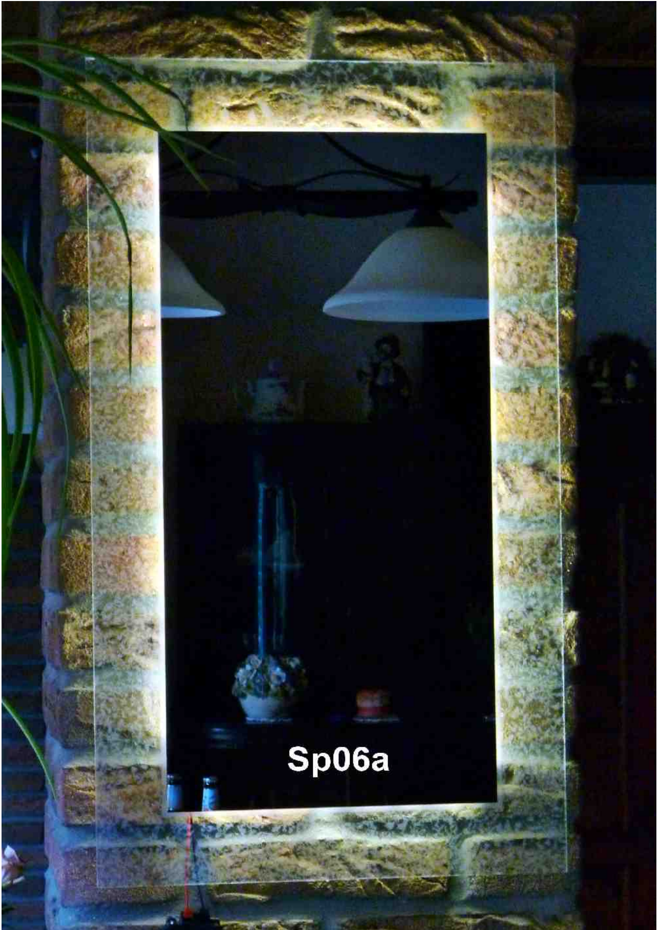
Sp06a Rückseite Eisblume SMD- Licht